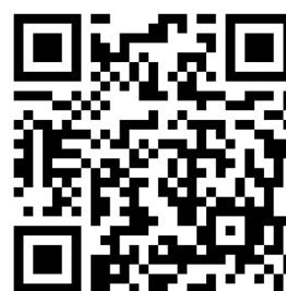
説明会申込みQRコード